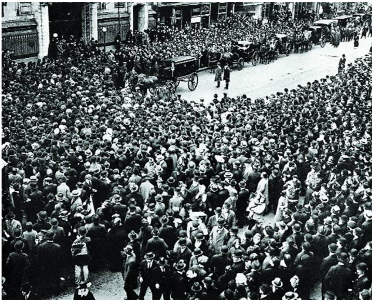
Похороны Шолом-Алейхема, Нью-Йорк, 1916

При этом главные надежды Шолом-Алейхема, возвращаясь в контекст русско-японской войны, — на то, что под давлением мирового сообщества Российская империя, нуждающаяся в займах, пойдет на уступки и предоставит евреям равные права.