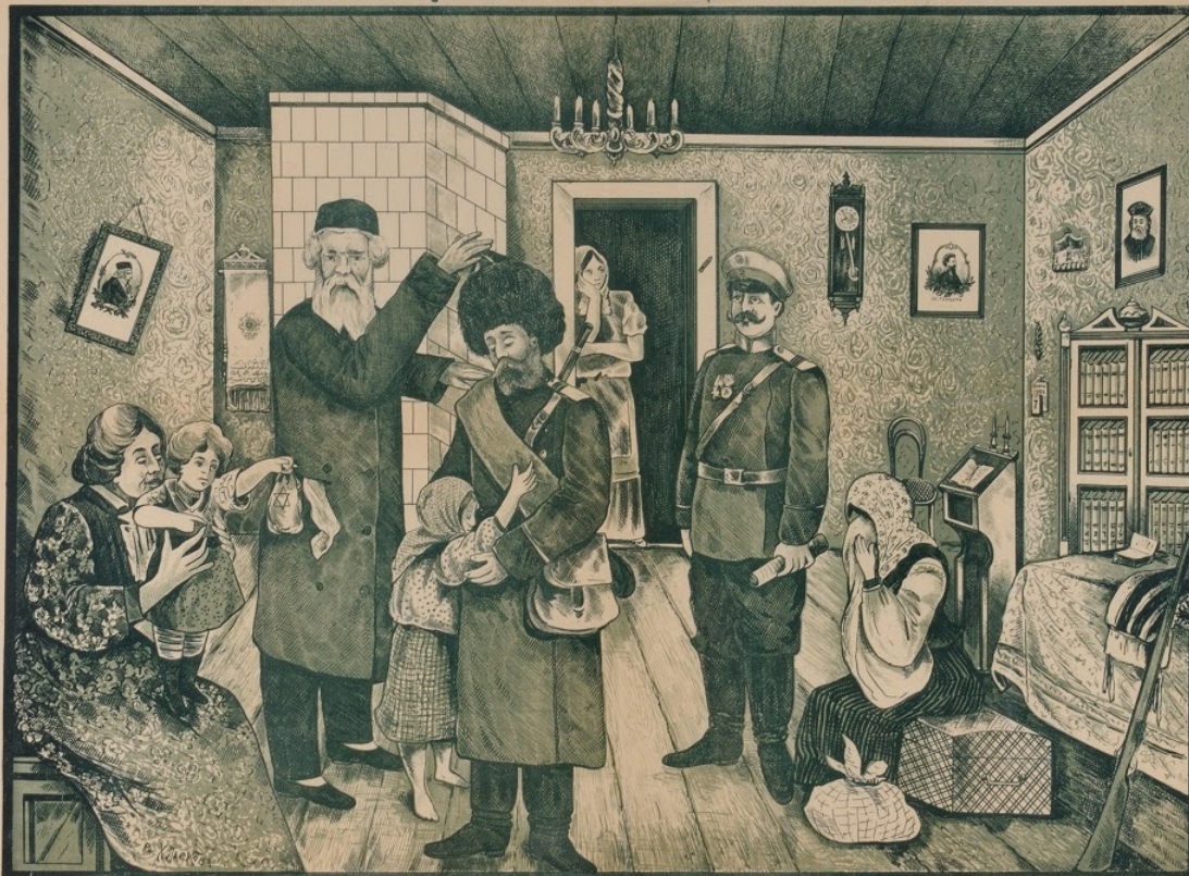
Проводы на войну. Еврейская открытка, 1905