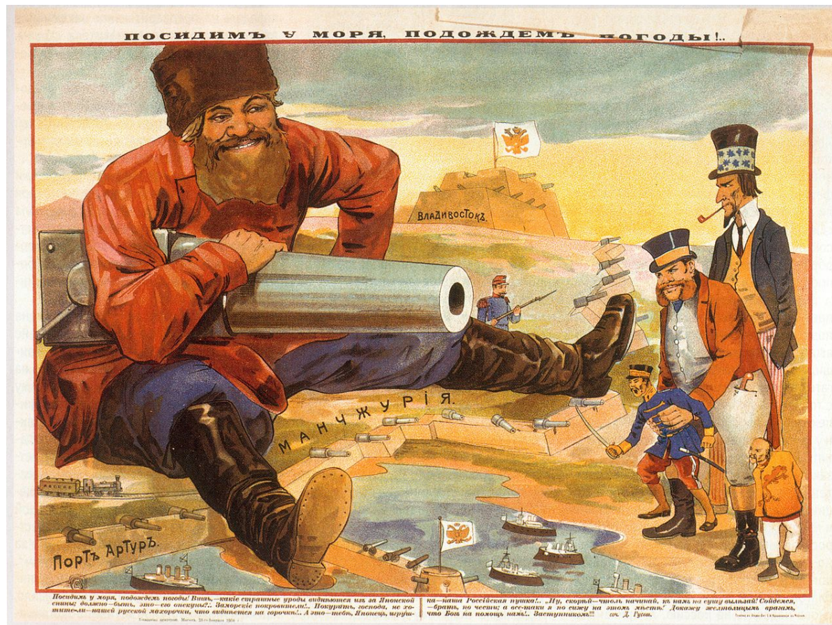
Российская «шапкозакладательская» карикатура, 1904

традиция недаром воспринимает службу в русской армии как большое наказание — многих (в отличие от армий стран Западной Европы) вынуждали креститься — солдату-христианину служилось намного проще.