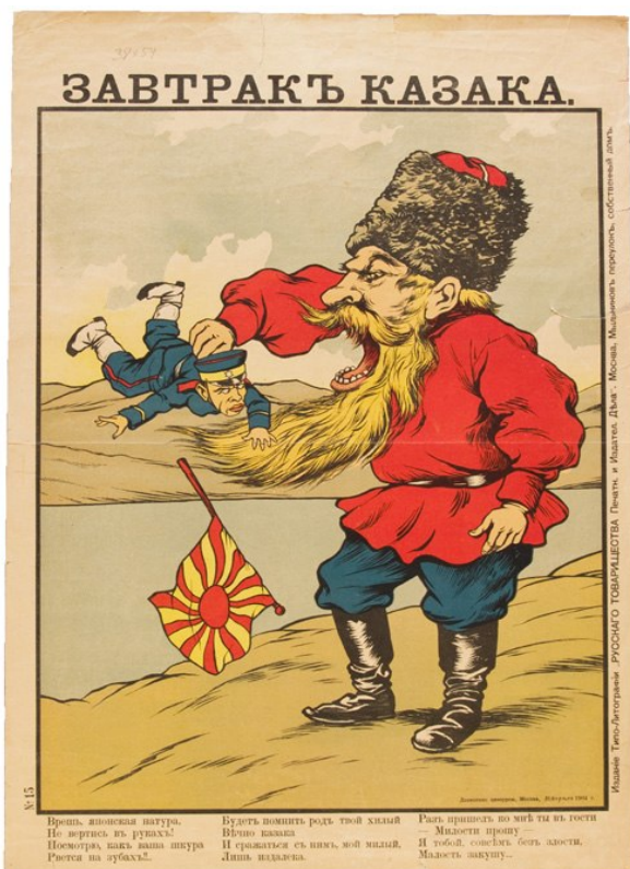
Русская карикатура, 1905