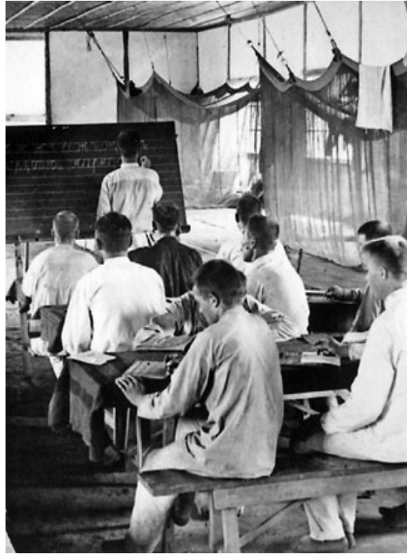
Урок для русских солдат в лагере для военнопленных, Мацуяма

Есть описание визита японских чиновников на пасхальный седер — о том, с каким уважением они отнеслись к происходящему, пытаюсь понять, о чем же поют евреи, и призывая не обращать на них внимания.