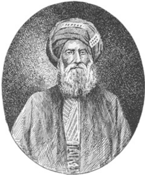
Давид Сассун — основатель знаменитой династии

Ганди указывал, что Индия и Южная Африка являются частью Британской империи, и надеялся, что обещанные свободы распространятся на индийских подданных, иммигрировавших в другую часть империи. В девяти выпусках Indian Opinion за 1906-07 гг. упоминаются законодательные маневры, связанные с идишем — Ганди был постоянно озабочен этим вопросом.