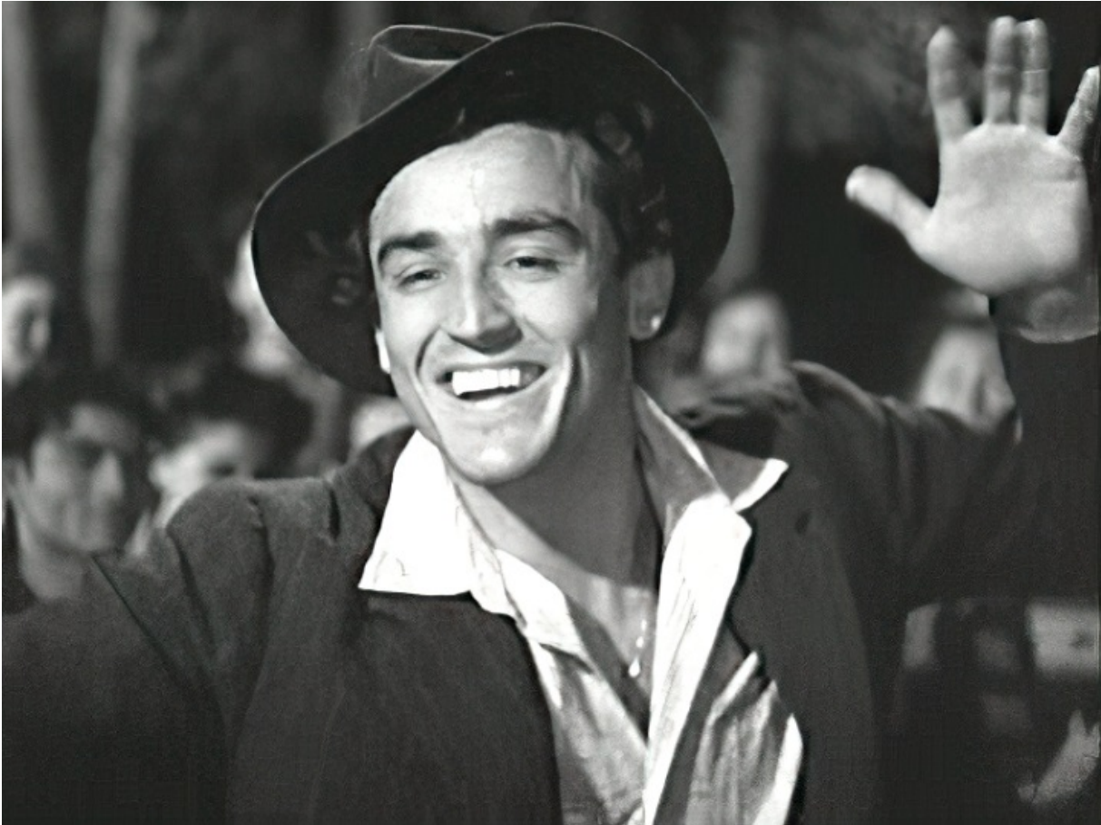
Вітторіо Гассман, 1949

В американському фільмі «Рапсодія», що йшов у радянському прокаті, його партнеркою була Елізабет Тейлор. В іншій американській картині — «Війна та мир» за романом Толстого — Вітторіо Гассман зіграв Анатолія Курагіна.