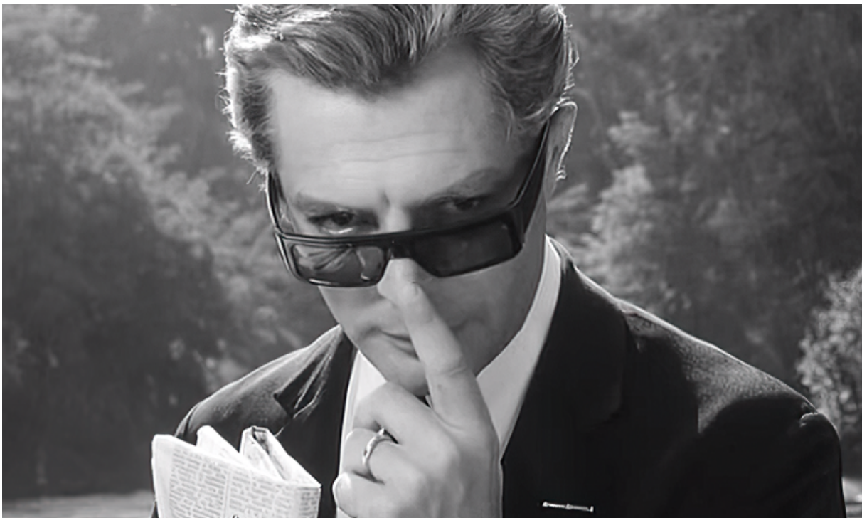
Марчелло Мастроянні у фільмі «Вісім з половиною», 1963