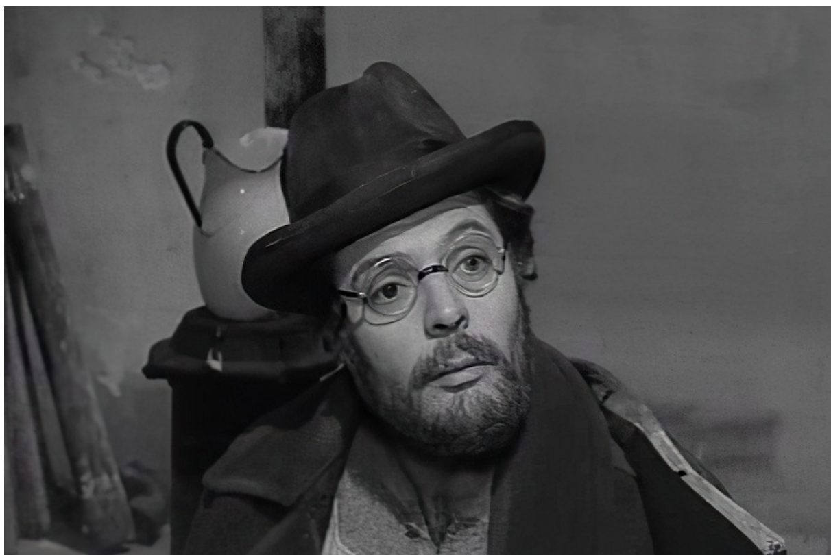
Марчелло Мастроянні, 1963