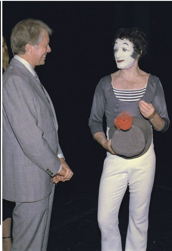
С президентом США Картером, 1977

Неудачным приключениям Бипа во всем, к чему он прикасался, будь то бабочки или львы, корабли или поезда, танцзалы или рестораны — не было конца.