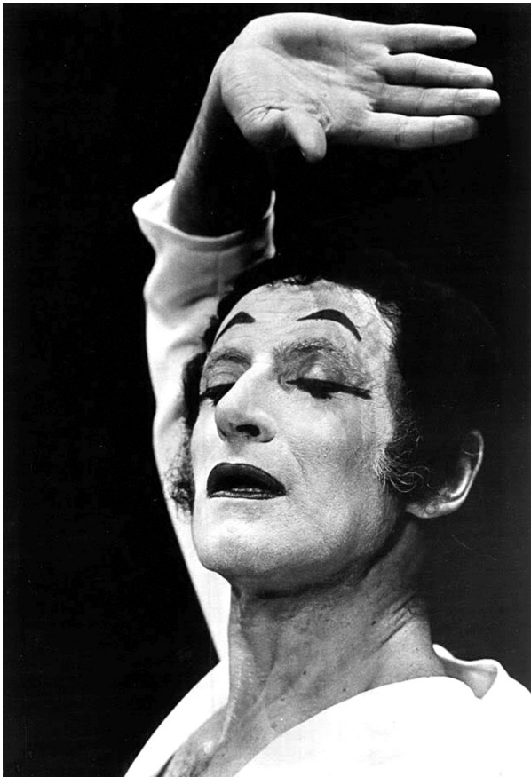
Великий мим в 1971 году

публике в «Карманном театре» в Париже. Он был одет в полосатый пуловер и потрепанную шелковую оперную шляпу с цветком. Этот костюм символизировал хрупкость жизни, и Бип стал «альтер эго» Марсея, подобно тому, как «Маленький бродяга» стал двойником Чарли Чаплина.