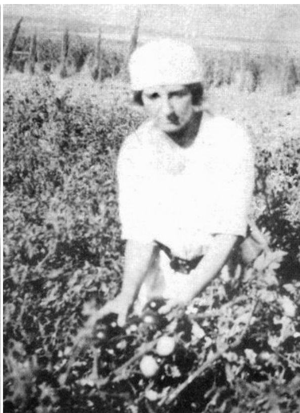
На полях кибуца Мерхавия, 1920-е