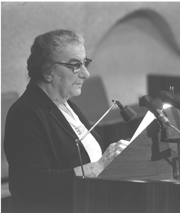
На трибуне премьер-министра, 10 марта 1974

«Неприятные парни» — это все, что смогла выдать из себя глава правительства после встречи с лидерами «Черных пантер» — молодежью из бедных «восточных» кварталов, где ненависть к ашкеназскому истеблишменту стала приобретать наследственные черты. Масла в огонь межобщинной напряженности подлили и льготы новым репатриантам из Советского Союза, которые в начале 1970-х стали прибывать в Израиль, льготы, которые государство просто не могло позволить себе в 1950-е для олим из арабских стран.