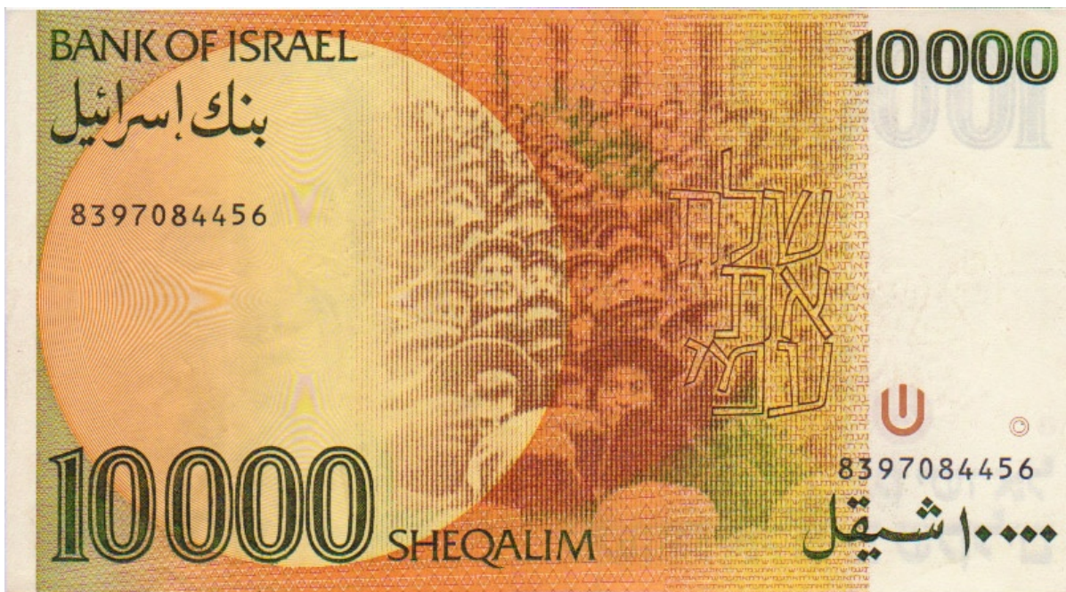
Фото толпы у московской синагоги, встречающей Голду Меир, воспроизведенное на банкноте

И это несмотря на вышедшую накануне в «Правде» статью-предупреждение Ильи Эренбурга о том, что государство Израиль не имеет никакого отношения к евреям Советского Союза, где нет еврейского вопроса... Сталинский намек адресовался не только советским евреям, но и расшифровывал для израильских посланников реалии страны пребывания.