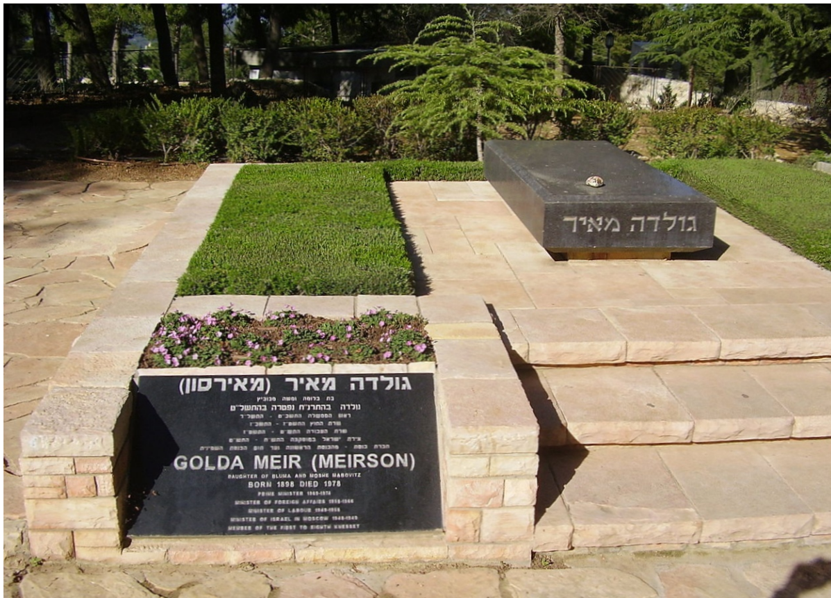
Могила Голды на горе Герцля в Иерусалиме

Свалив всю ответственность на армейское командование, правительство рассчитывало выйти сухим из воды, и это переполнило чашу общественного терпения. Голда подает в отставку, и ее знаменитая «политическая», а на самом деле вполне реальная кухня, где она, в жарких спорах, выпивая до двадцати чашек кофе в день и выкуривая по две пачки сигарет, принимала важнейшие решения, становится частью истории.