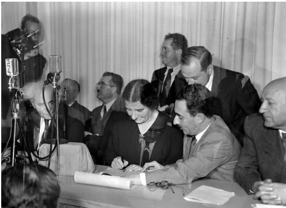
На подписании Декларации независимости Израиля, 14 мая 1948

Встреча прошла в лучших традициях восточного этикета. Впрочем, иорданский монарх был вполне искренне расположен к евреям, но... выступить против воинствующей позиции Арабской лиги не посмел.