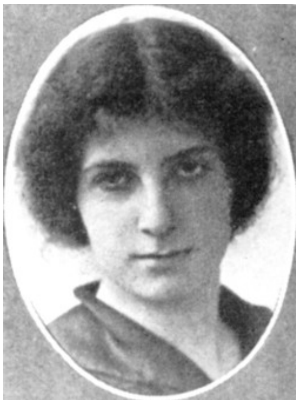
Голда в 1914 году, Милуоки, США

Как политик будущий премьер сформировалась в то, уже кажущееся неправдоподобным время, когда она — секретарь исполкома Гистадрута (Федерации трудящихся) — получала меньше, чем сторож профсоюзного офиса, ведь у него было девять детей, а у Голды только двое. И в этом, по воспоминаниям самой Меир, в последние годы жизни — почетного президента Социалистического интернационала, был «добрый социалистический смысл».