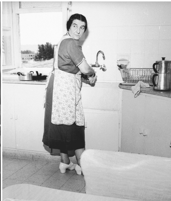
...и на своей кухне.