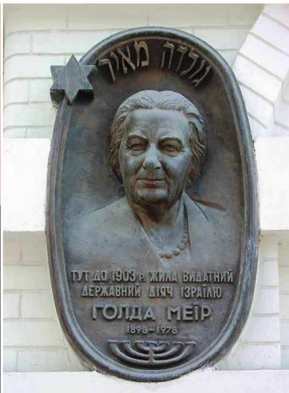
Мемориальная доска Голде Меир, ул. Бассейная, 5а, Киев