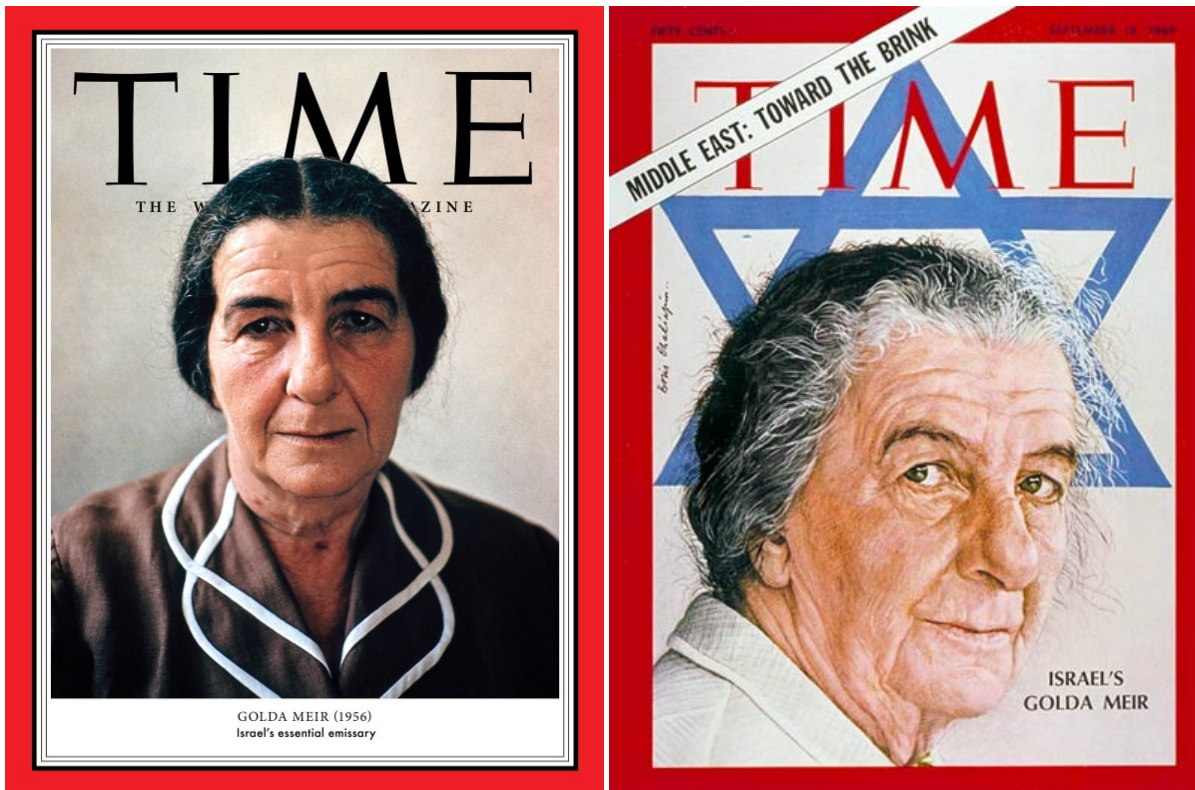
Голда на обложке TIME